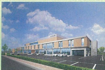
医療法人佐藤病院